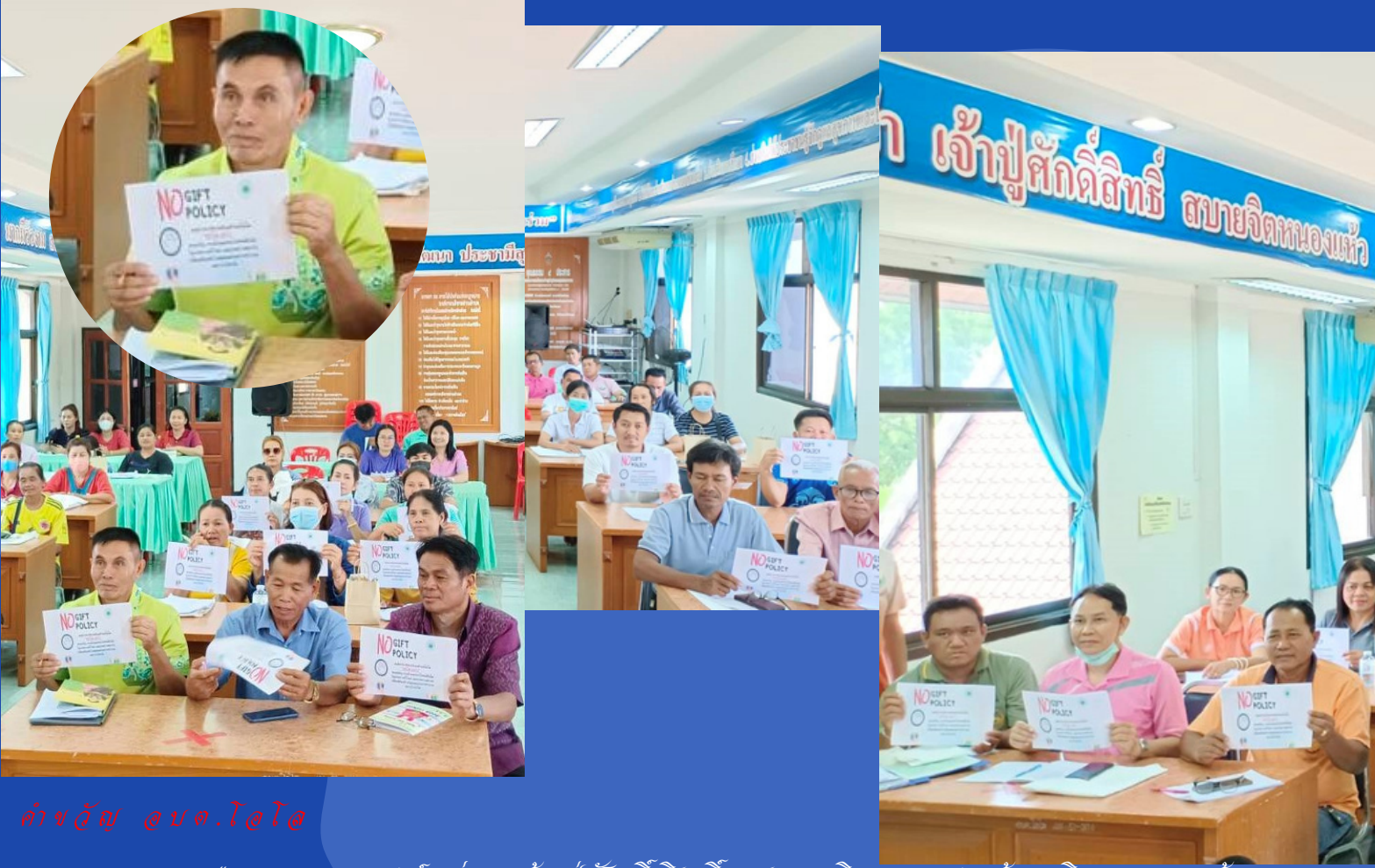
คำขวัญ อบต.ไอโเอ

ร้อยตำรวจเอก ลำพูน แนนไอโเอ นายกองค์การบริหารส่วนตำบลไอโเอ